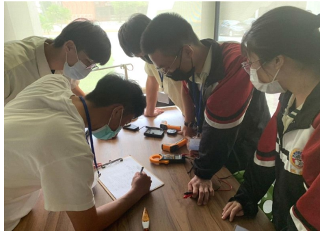
黎明中學學生為測量節能電流所做的分析實驗。

黎明高中校長羅家強說，黎明高中課程重視多元學習、潛能探索、生涯規畫，「只有參與黎明中學的沉浸式學習，才能一窺究竟」。