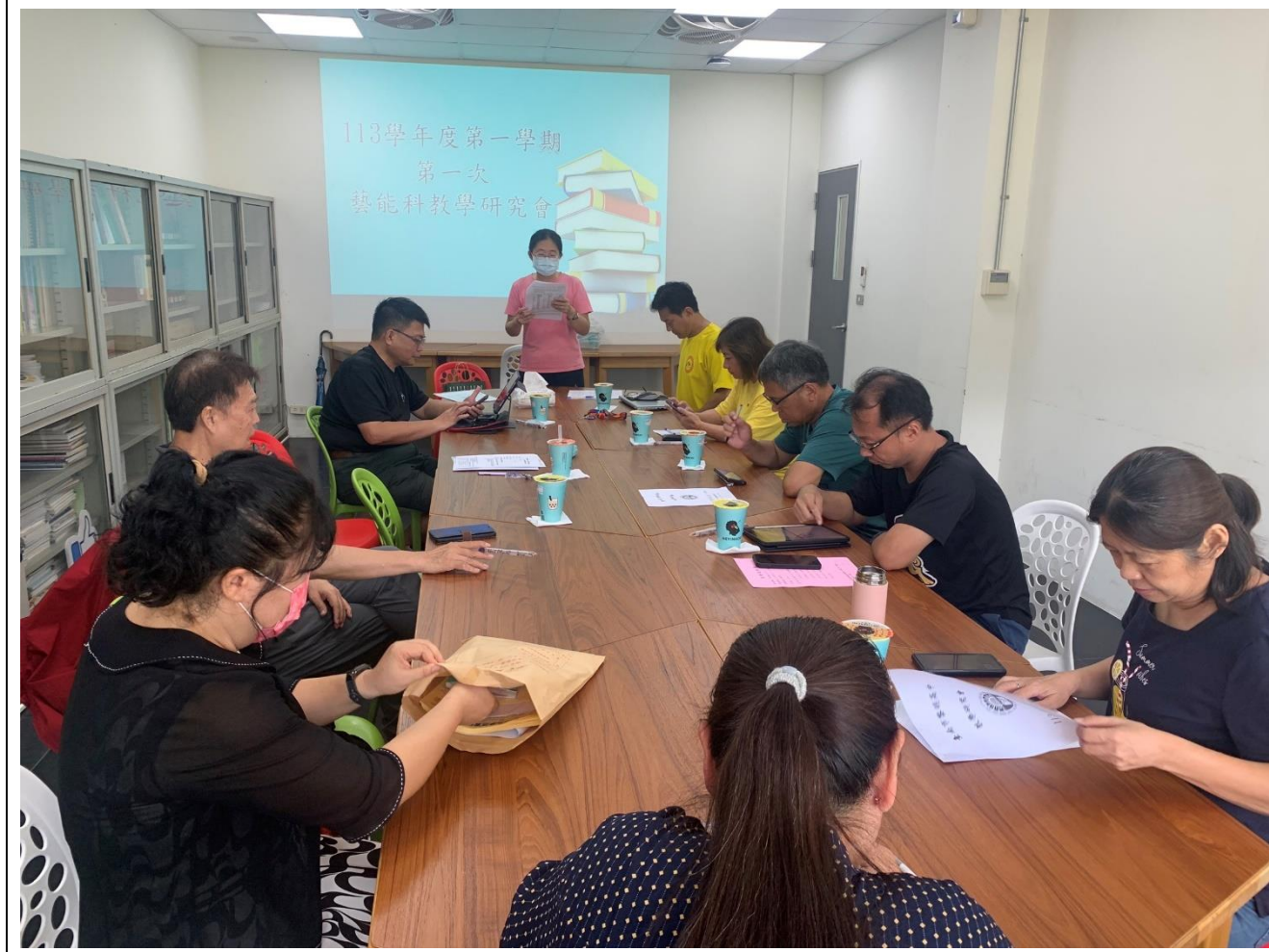
照片說明:主席報告