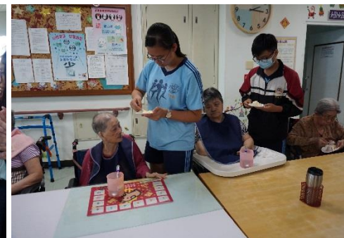
來!吃一口好吃的生日蛋糕