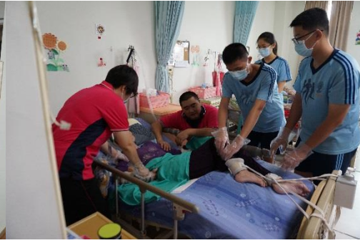
逗陣來學習為長者按摩