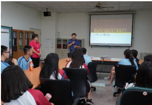
主任肯定同學的熱情參與逗陣

這一天同學們認真投入，經驗學習許多。看到年長者，不難想到父母，祖父母有一天也會衰老，也可能住進養護中心。面對不能行動的長者心中不免有幾分感傷，需及時行孝，珍惜家人相處的時間。單純的給予時間，聆聽與陪伴彌足珍貴。