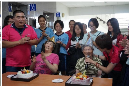
阿嬤過生日歡喜嗎？