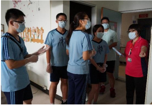
服務前口罩與手套帶好