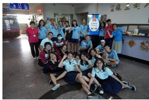
與社工及學姊大合照!