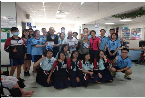
與划龍舟得勝者合照