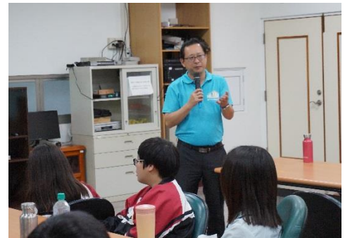
校長來給同學加油打氣