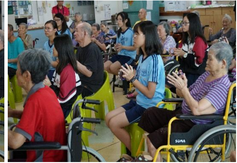
逗陣來 play music