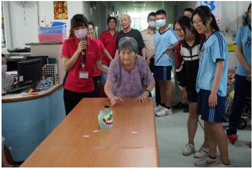
看我的龍舟跑多遠!!