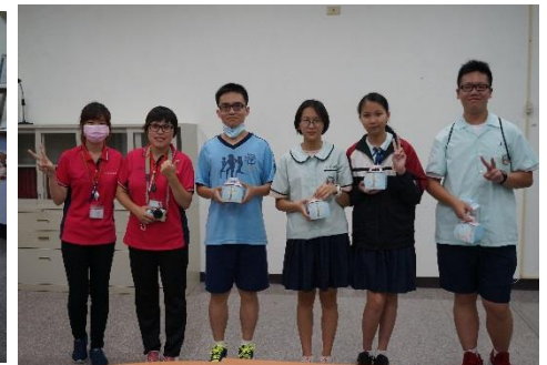
我們也有參加划龍舟喔!