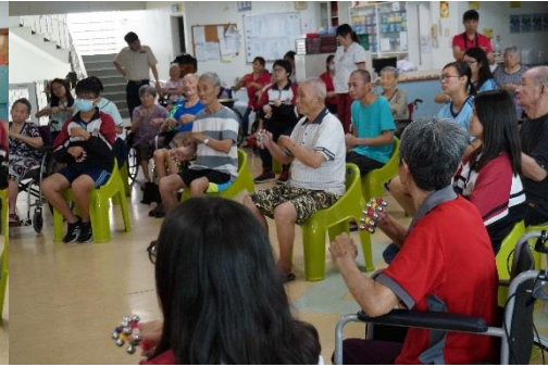
逗陣來 play music