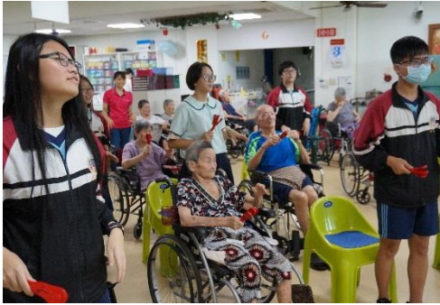
逗陣來 play music