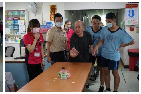
我的龍舟才真的厲害!!