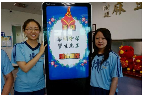
我們是黎明的志工學生